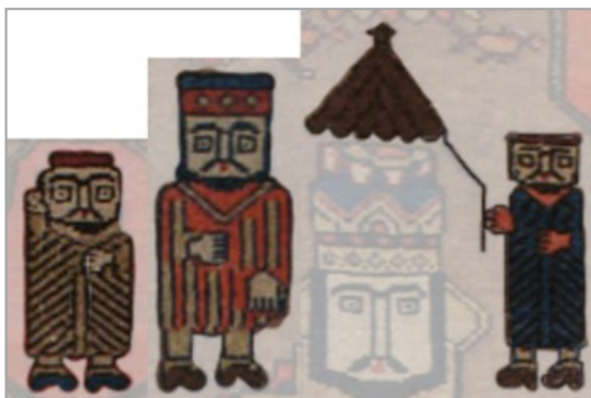
تصویر ۱۰. بخشی از تصویر ۴، ترتیب صوری فیگورهای انسانی طبقه پیشه‌ور (نگارندگان)