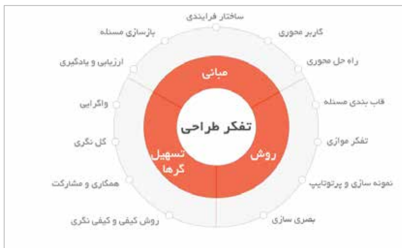
تصویر ۴. ارکان تفکر طراحی در سه قاب: مبانی، روش و تسهیل‌گرها (نگارندگان)