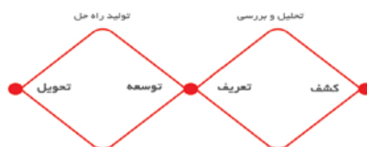
تصویر ۱. فرایند دبل دایموند (www.dstudio.ubc.ca)

- روند غیر خطی: در اغلب تعاریف گام های پروسه، طراحی سیال و غیر خطی است. تجربه طراحان بارها نشان داده ایشان ترجیح می دهند هر زمان به تناسب نیاز در میان فازهای مختلف حل مسئله، در آمد و شد باشند. این نگاه با نحوه واقعی عملکرد ذهن طراح که در هر لحظه دائماً در حال